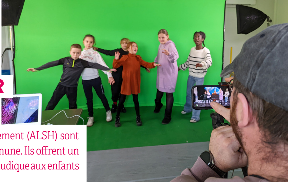
Les effets spéciaux font leur cinéma aux ALSH.

Les Accueils de Loisirs Sans Hébergement (ALSH) sont des incontournables dans notre commune. Ils offrent un environnement sécurisé, stimulant et ludique aux enfants pendant les vacances scolaires.