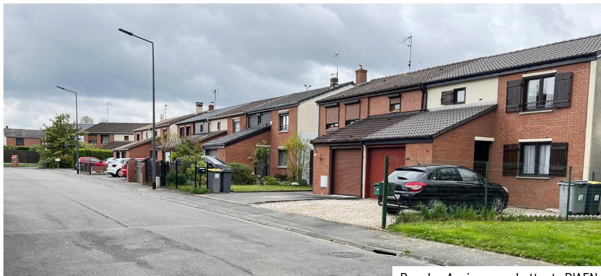
Rue des Anciens combattants D'AFN