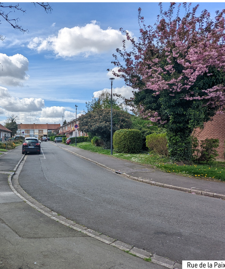
Rue de la Paix

proposés, la commune s'assure d'une densification limitée et d'une qualité urbaine et patrimoniale respectée.