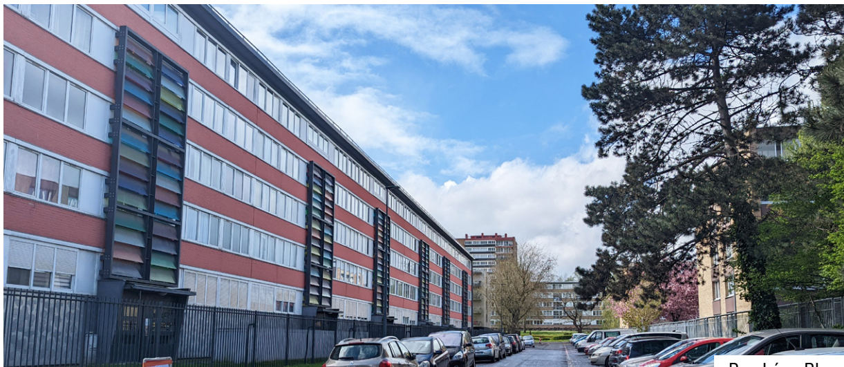
Rue Léon Blum