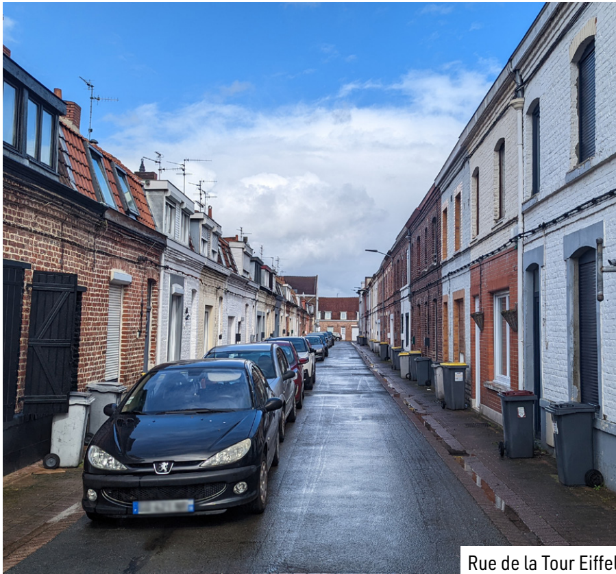
Rue de la Tour Eiffel