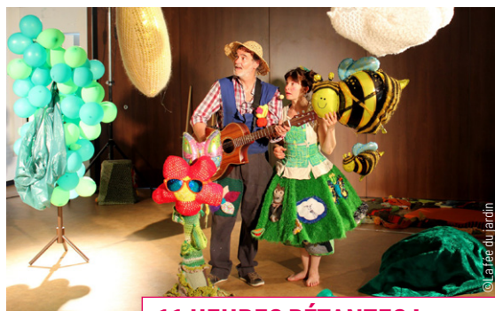
11 HEURES PÉTANTES ! Le jeune public a rencontré « la fée du jardin » à la salle des Bains-Douches.