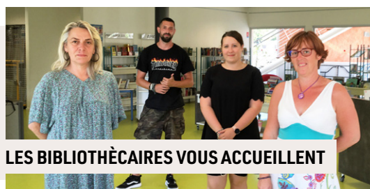
LES BIBLIOTHÉCAIRES VOUS ACCUEILLENT