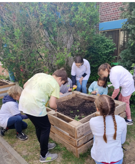
PLANTATIONS de fleurs et plantes aromatiques à l'école Saint Luc, en partenariat avec les CME.