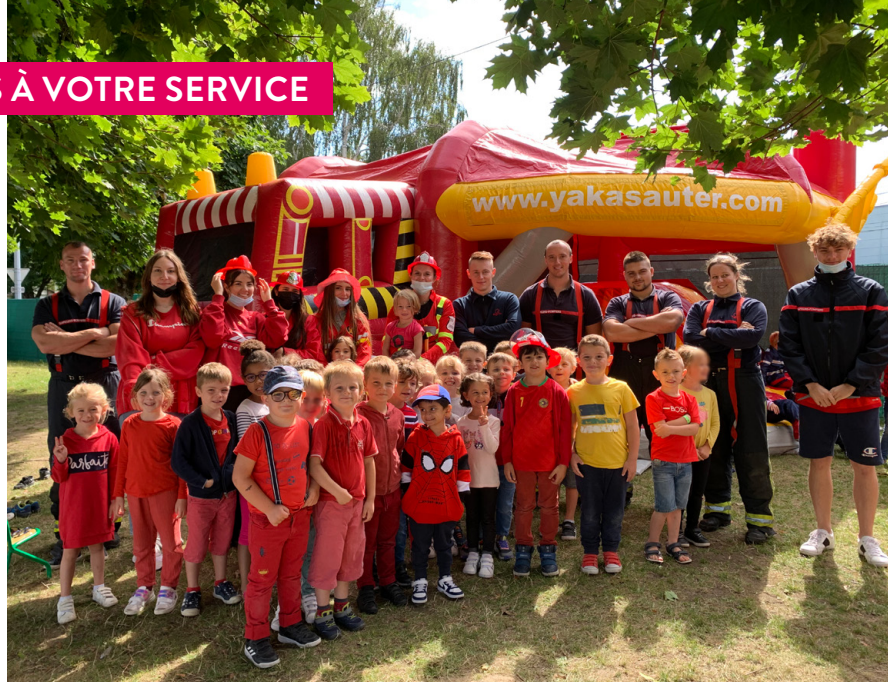
Merci aux sapeurs-pompiers du SDIS59 pour leur participation.