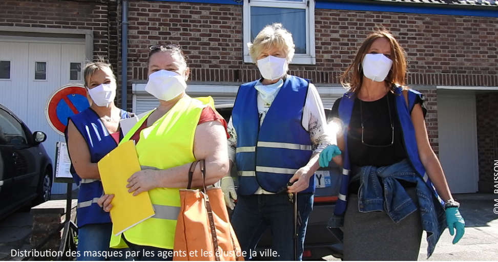
Distribution des masques par les agents et les élus de la ville.