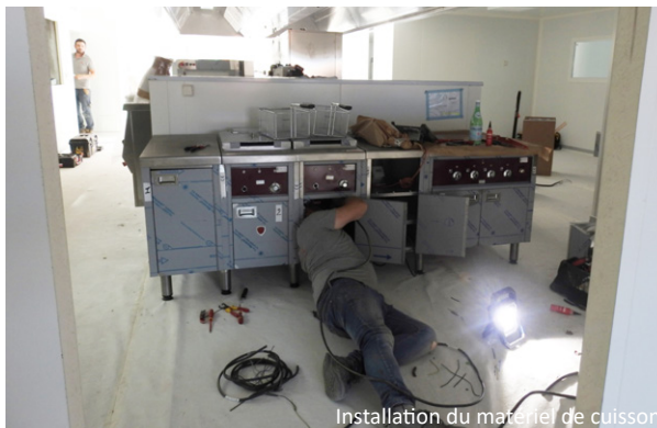
Installation du matériel de cuisson.

de trois mois. Rien de grave, les services municipaux ont revu l'enchaînement avec la tranche 2, celle de l'école maternelle. Pour mémoire, cette deuxième partie du projet nécessite