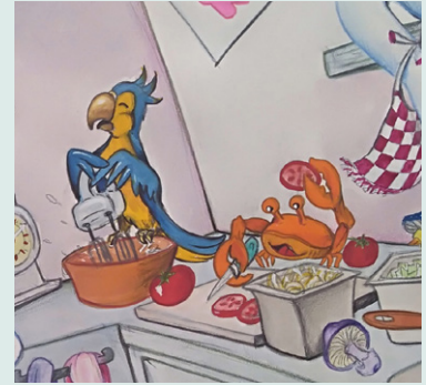
Détail de la fresque qui sera dévoilée dans le prochain Lys info