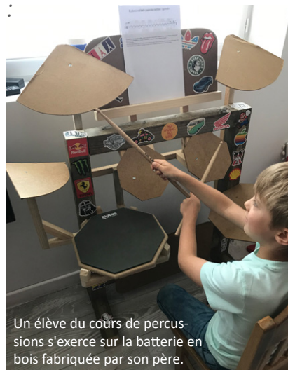
Un élève du cours de percussions s'exerce sur la batterie en bois fabriquée par son père.

> La distribution des masques par les agents et les élus : plus de 10 000 masques lavables offerts par la ville, distribués en porte à porte, pour éviter les déplacements, puis avec le déconfinement, disponibles en mairie.