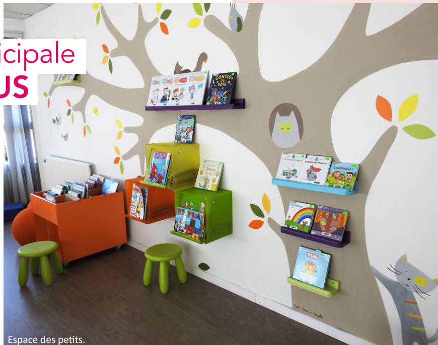
Espace des petits.

La bibliothèque de Lys-lez-Lannoy est devenue une véritable "croisée des chemins"