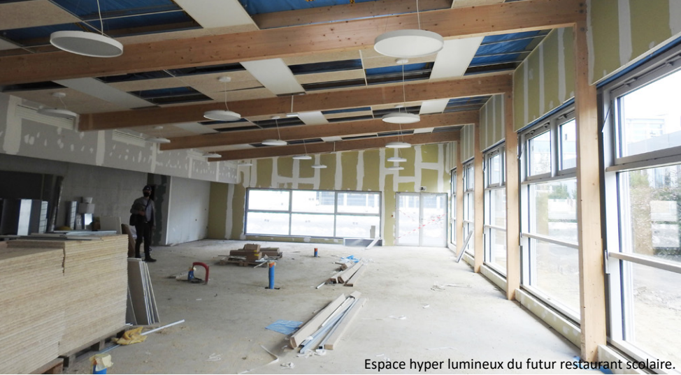
Espace hyper lumineux du futur restaurant scolaire.