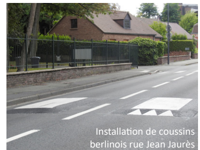
Installation de coussins berlinois rue Jean Jaurès