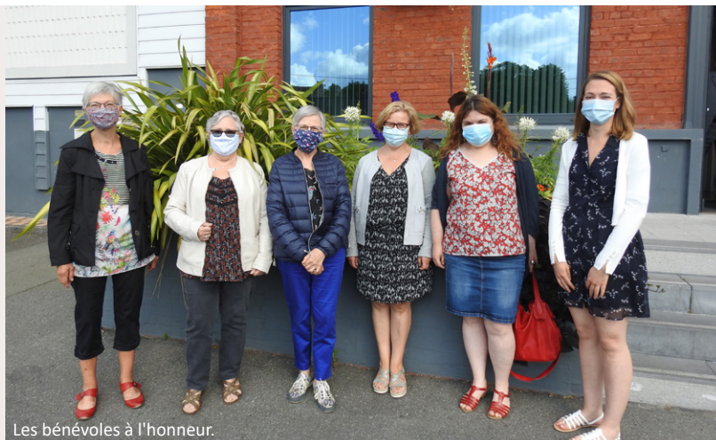
Les bénévoles à l'honneur.

Près de 800 masques confectionnés par des Lyssoises !