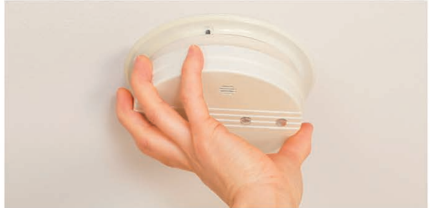
Le détecteur de fumée, équipement obligatoire dans votre logement à compter du 8 mars 2015.

L'échéance approchant, nombreuses sont les personnes qui se