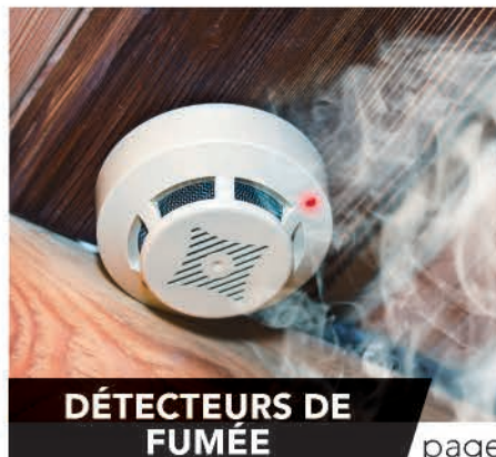
DÉTECTEURS DE FUMÉE

L ES 22 et 29 mars prochain, les élections Départementales (nouvelles dénomination des élections cantonales) désigneront les nouveaux Conseillers Départementaux du canton de Croix dont la ville de Lys-lez-Lannoy fait partie. Vous pourrez exprimer vos suffrages de 8h à 18h dans vos bureaux de vote respectifs. Pour les nouveaux lyssois : pour voter à Lys-lez-Lannoy, il faut impérativement que votre inscription sur les listes ait été faite avant le 31 décembre 2014. Si ce n'est pas le cas, c'est alors dans votre ancienne commune que vous pourrez voter.