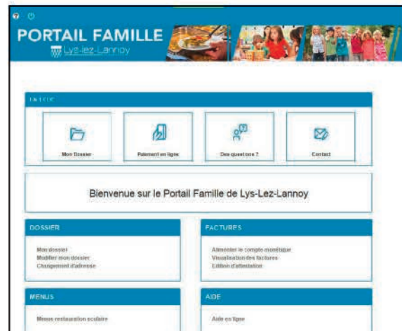
Page d'accueil du Portail Famille.

Il permet de consulter, gérer et créditer votre compte famille directement en ligne sur internet. Vous pouvez notamment payer la cantine et la garderie scolaire, modifier vos coordonnées, éditer des attestations d'études surveillées et garderie ou tout simplement contacter le service régie de la mai-