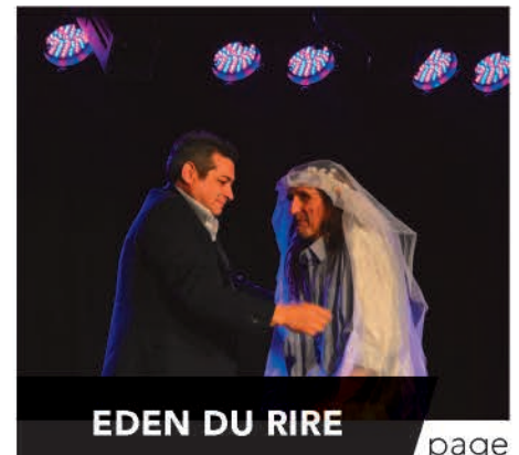
EDEN DU RIRE