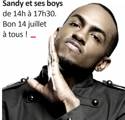
Colonel Reyel sera la tête d'affiche de cette édition