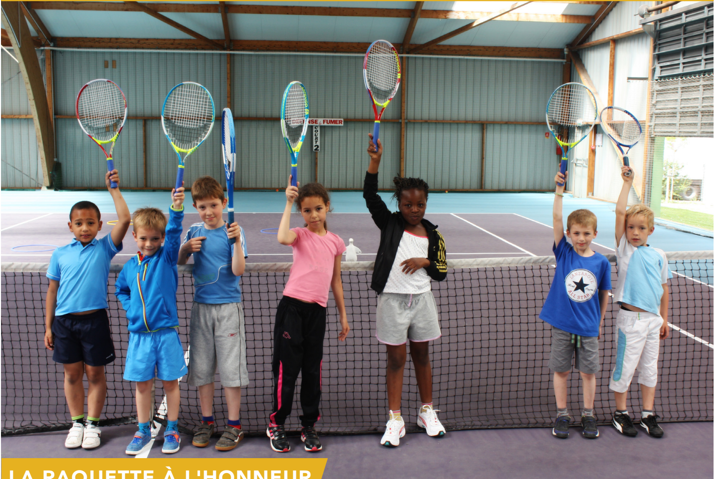
LA RAQUETTE À L'HONNEUR

JOURNAL D'INFORMATIONS MUNICIPALES À télécharger sur www.ville-lyslanzlannoy.com