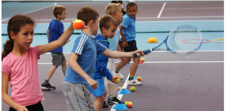
Les petits tennismen (et women) en pleine séance de tir de précision.

organise des stages pendant les petites vacances, mais aussi plusieurs animations tout au long de l'année.