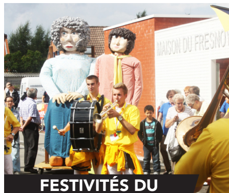
FESTIVITÉS DU FRESNOY