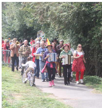
La bonne humeur est de rigueur lors de ce weekend

A partir de 14h30, petits et grands prendront part à une après-midi festive. Au programme, défilé avec les